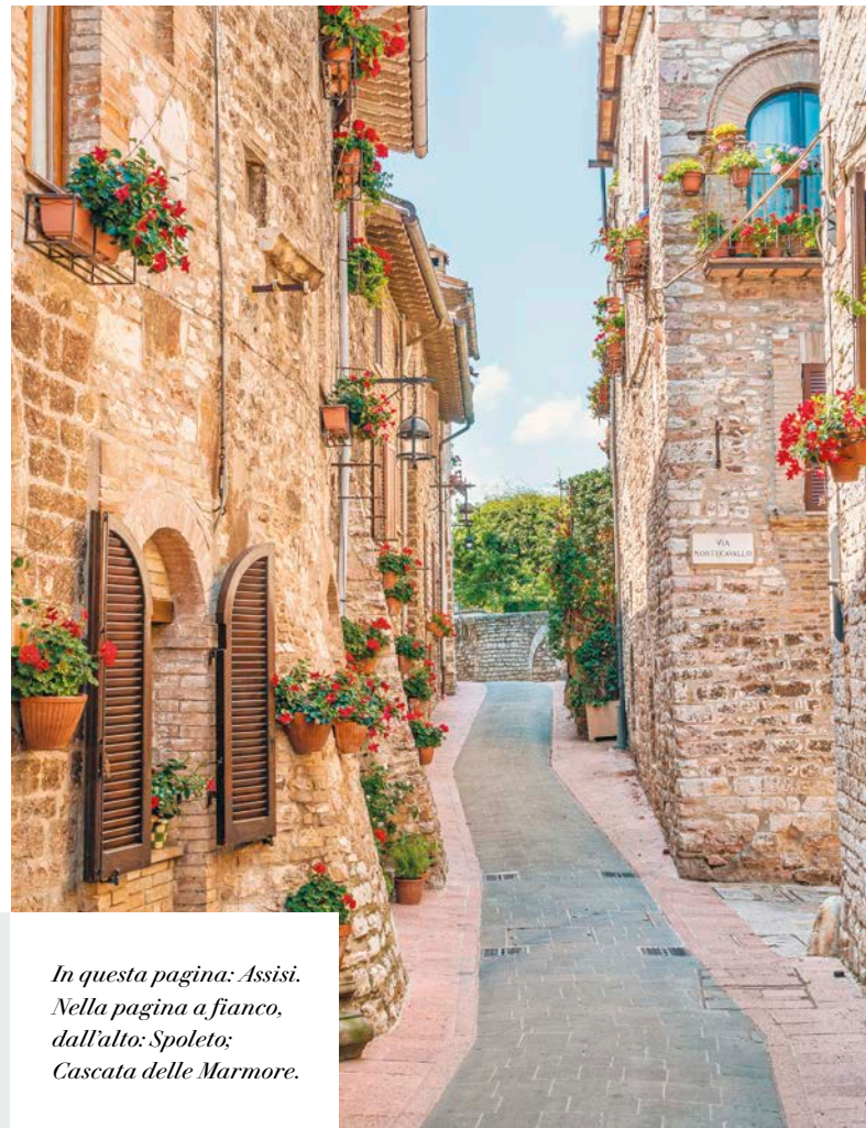
In questa pagina: Assisi. Nella pagina a fianco, dall'alto: Spoleto; Cascata delle Marmore.