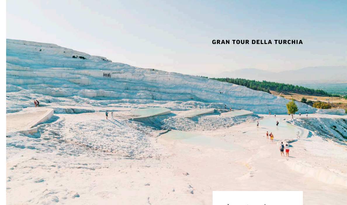
In questa pagina, in alto: Pamukkale. In basso, da sinistra: Kusadasi; mausoleo di Ataturk ad Ankara.

La giornata di oggi inizia con la possibilità di partecipare ad un suggestivo giro facoltativo in mongolfiera all'alba .