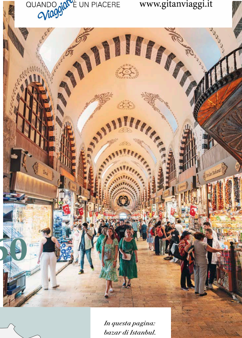
In questa pagina: bazar di Istanbul.