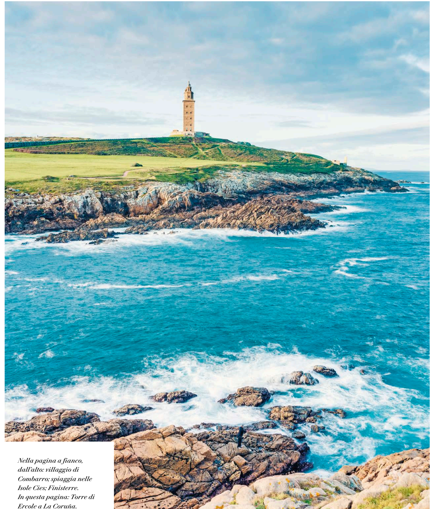
Nella pagina a fianco, dall'alto: villaggio di Combarro; spiaggia nelle Isole Cies; Finisterre. In questa pagina: Torre di Ercole a La Coruña.

La Coruña: visita al Museo Archeologico di San Anton, seguito da un giro in barca.