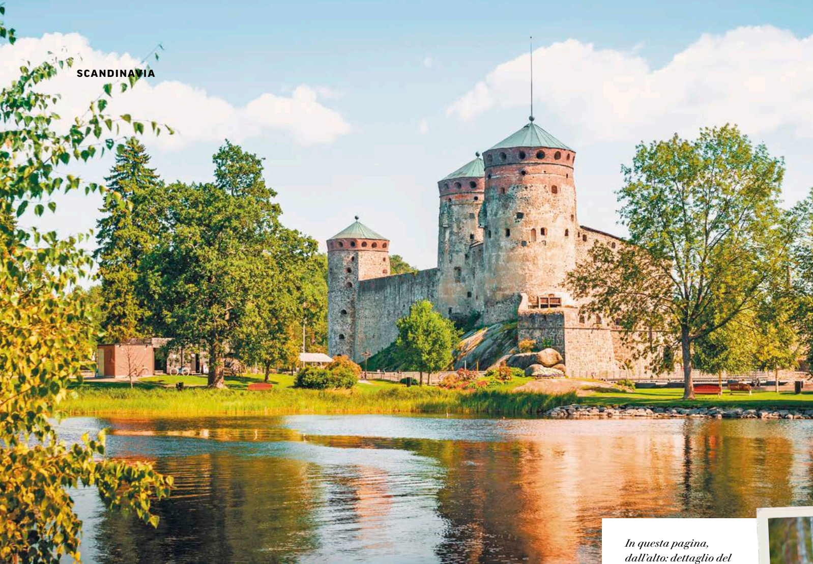
In questa pagina, dall'alto: dettaglio del castello di Savonlinna; Porvoo.