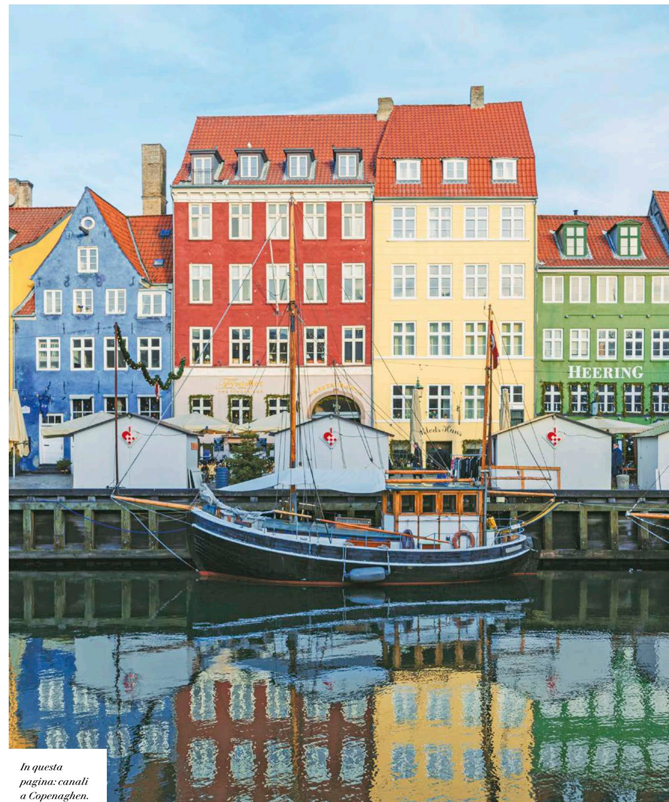
In questa pagina: canali a Copenaghen.

Stoccolma: Palazzo Drottningholm e Museo Vasa.