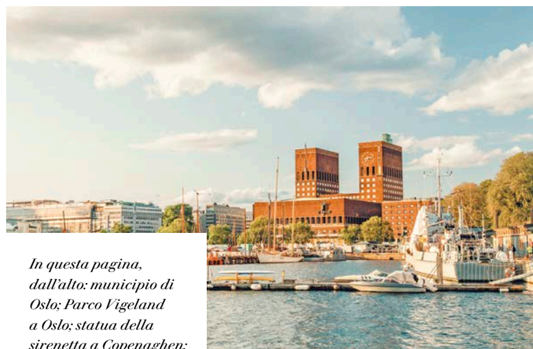
In questa pagina, dall'alto: municipio di Oslo; Parco Vigeland a Oslo; statua della sirenetta a Copenaghen; Göteborg.