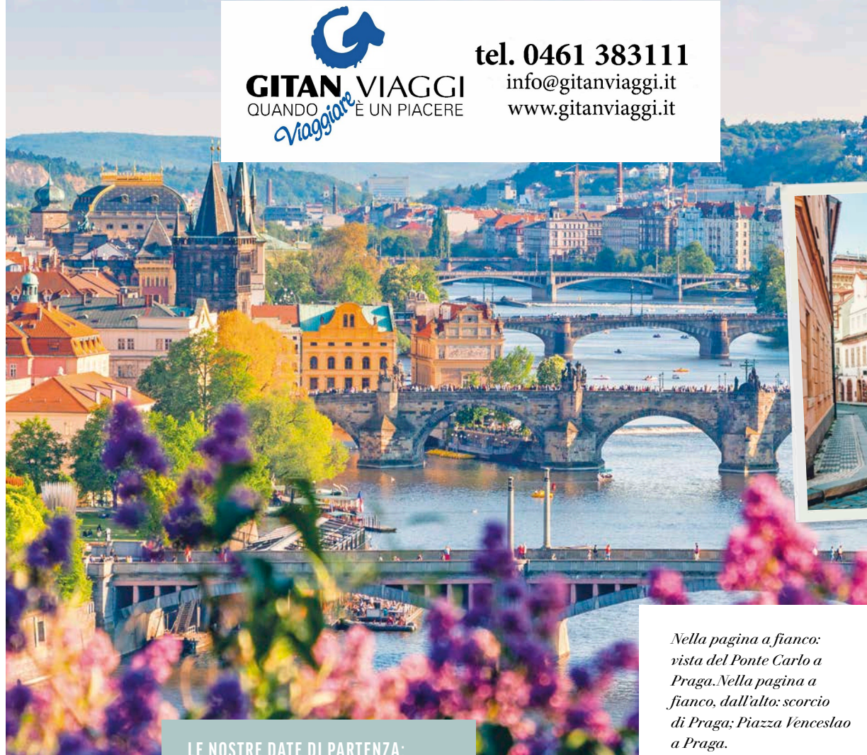
Nella pagina a fianco: vista del Ponte Carlo a Praga. Nella pagina a fianco, dall'alto: scorcio di Praga; Piazza Venceslao a Praga.

tel. 0461 383111 info@gitanviaggi.it www.gitanviaggi.it