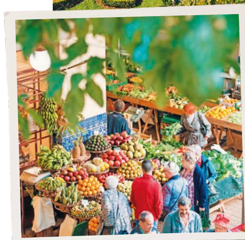
In questa pagina, dall'alto: giardino botanico di Funchal; Mercado dos Lavradores a Funchal; piscine naturali di Porto Moniz.