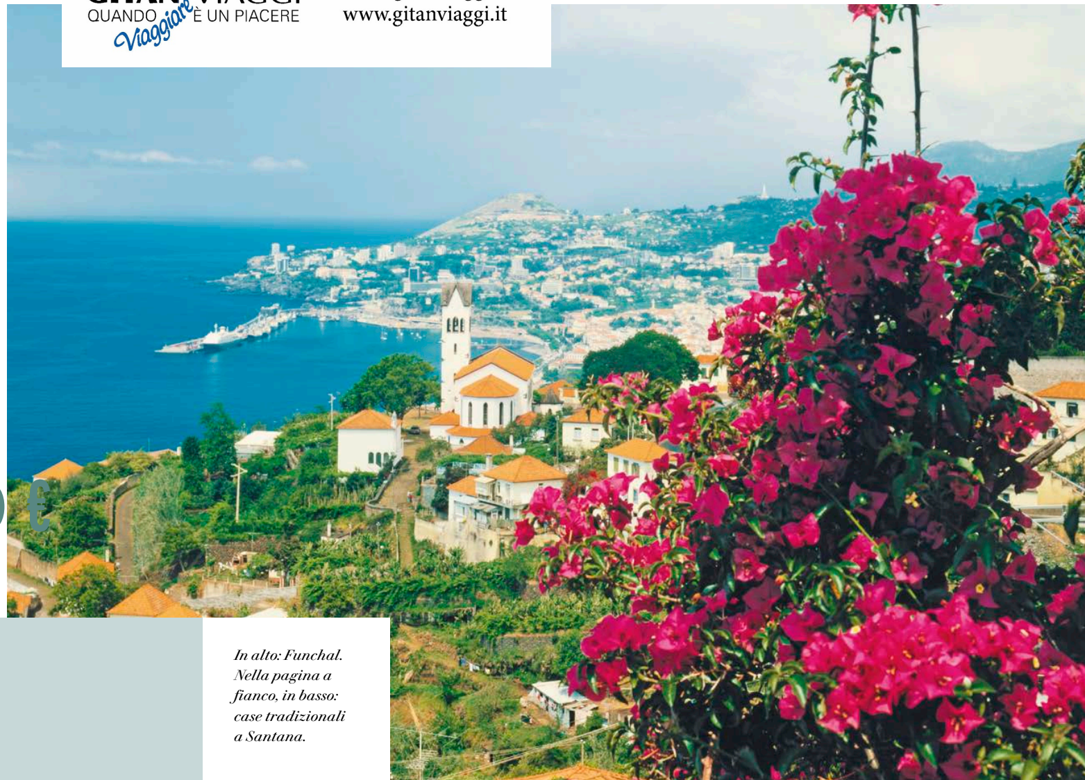
In alto: Funchal. Nella pagina a fianco, in basso: case tradizionali a Santana.