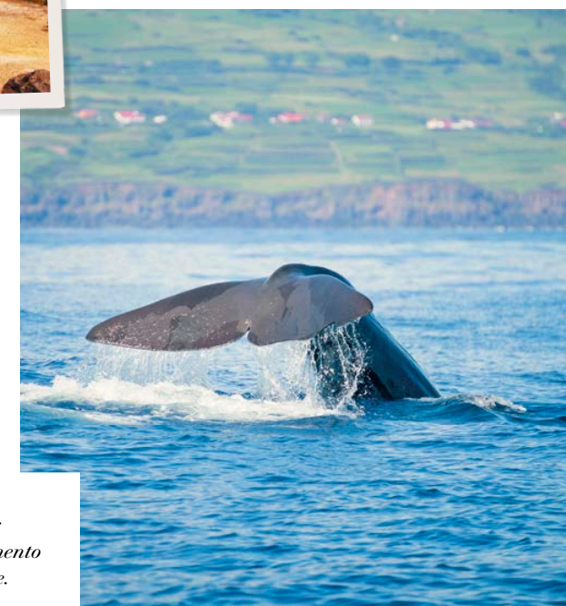
A destra: avvistamento di balene.