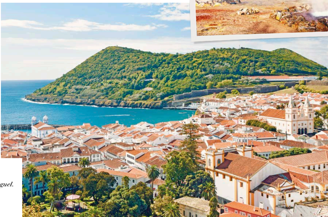
In alto: Furnas nell'isola di São Miguel. A destra: Angra do Heroísmo.

Il nostro viaggio nella magia delle Azzorre volge al termine, ed è arrivato il momento di salutare gli spettacolari paesaggi e le atmosfere uniche di queste magnifiche isole. Veniamo accompagnati all'aeroporto di Ponte Delgada con un trasferimento privato, in tempo utile per salire a bordo del volo di rientro che ci riporta in Italia.