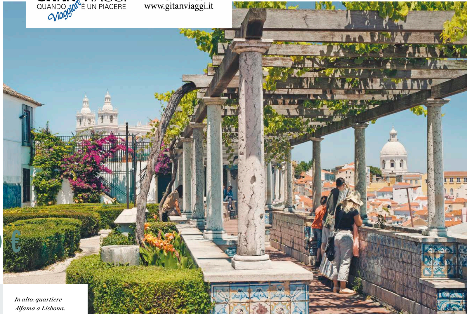
In alto: quartiere Alfama a Lisbona. Nella pagina a fianco, dall'alto: Obidos; Nazaré.