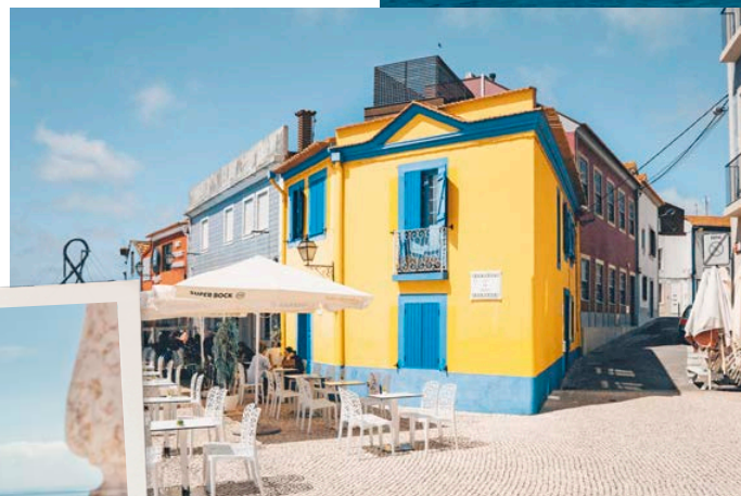
In questa pagina dall'alto: Porto; Aveiro; Chiesa di Santa Engrácia a Lisbona; Punta de Sagres nell'Algarve.