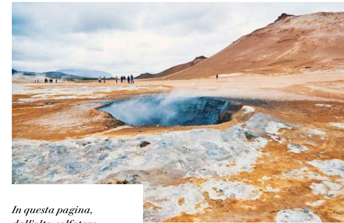
In questa pagina, dall'alto: solfatore di Námaskard; centro di Reykjavík; cascate di Dettifoss.