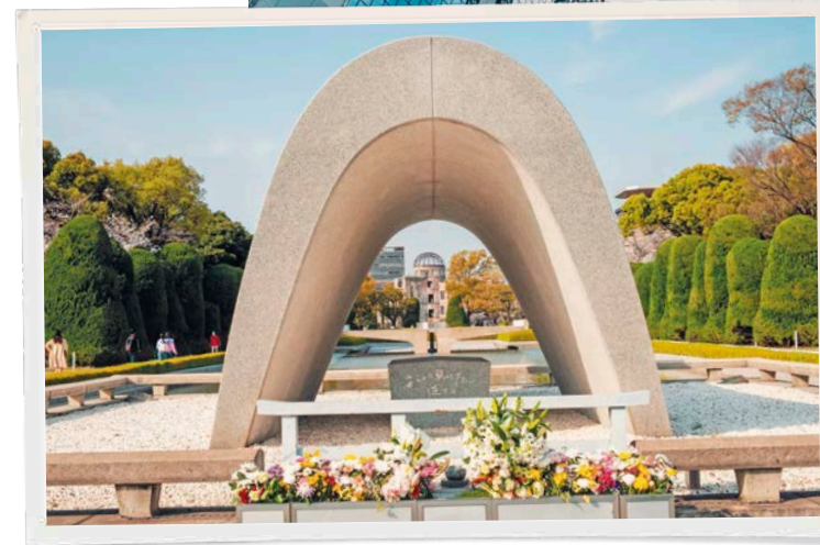
In questa pagina, dall'alto: Floating Garden Observatory a Osaka; Memoriale della Pace a Hiroshima; cervi nel Parco di Nara.