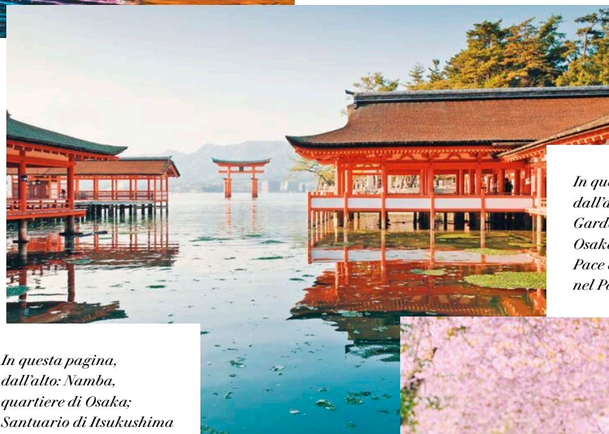
In questa pagina, dall'alto: Namba, quartiere di Osaka; Santuario di Itsukushima a Hiroshima; piantagioni di tè a Shizuoka.

che Patrimonio Mondiale dell'Umanità. Conosciuto anche come Castello dell'Airone Bianco , è uno dei 12 castelli originali del Giappone ancora intatti e la prima struttura risale a oltre 600 anni fa. Attualmente è composto da oltre 80 edifici collegati da una serie di sentieri tortuosi simili a un labirinto. Il mastio centrale ha sei piani, che più si sale e più si restringono, e all'ultimo piano si trovano un piccolo santuario e dei punti panoramici. Dopo la visita riprendiamo il viaggio in treno per Tokyo. Il pranzo è incluso nel corso delle visite e la cena è libera.