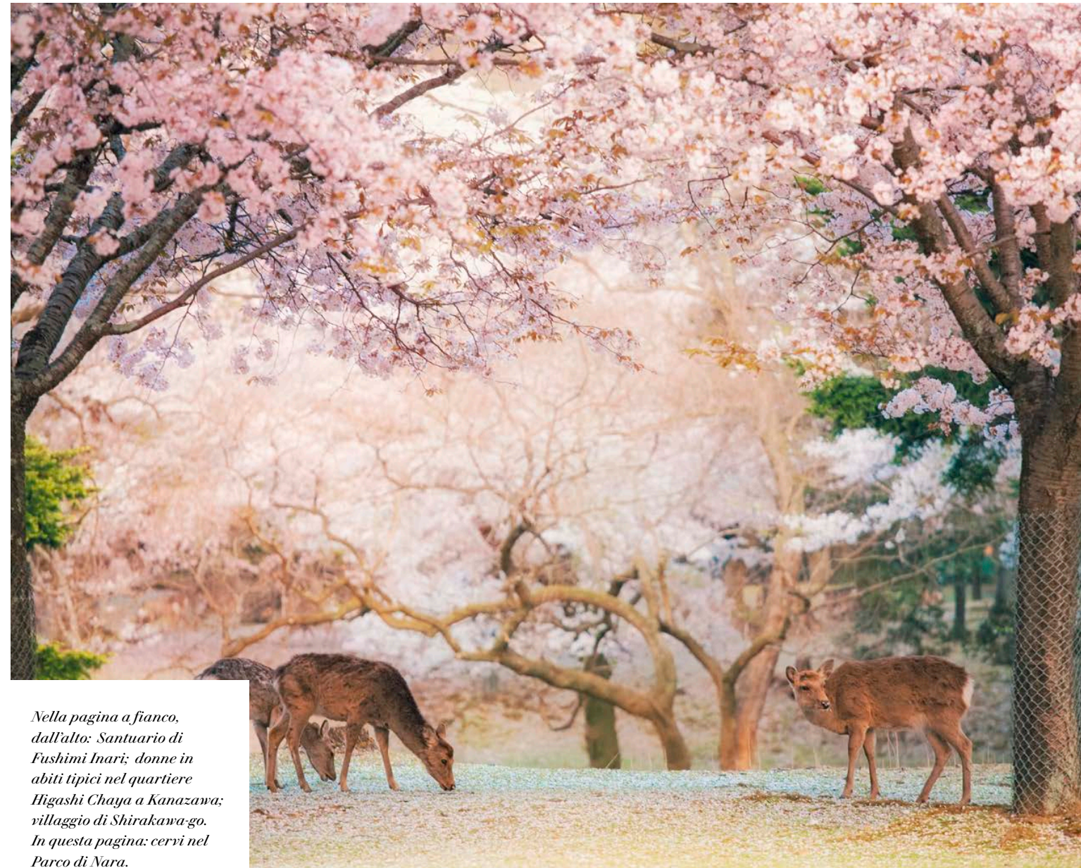
Nella pagina a fianco, dall'alto: Santuario di Fushimi Inari; donne in abiti tipici nel quartiere Higashi Chaya a Kanazawa; villaggio di Shirakawa-go. In questa pagina: cervi nel Parco di Nara.