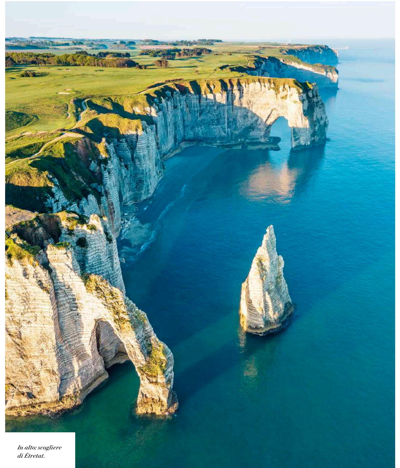
In alto: scogliere di Étretat.