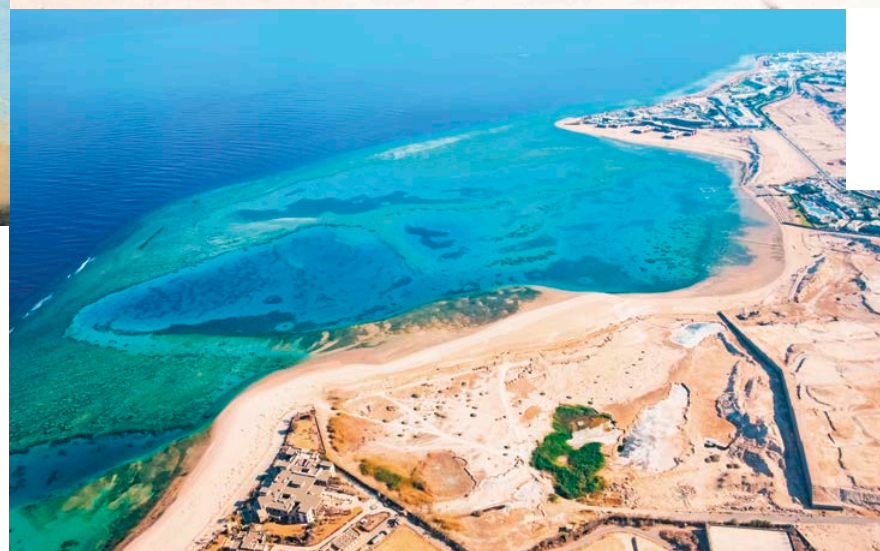
In questa pagina, dall'alto: barriera corallina; spiagge di Hurghada.