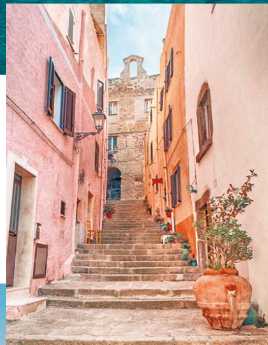
In questa pagina, dall'alto: Alghero; Castelsardo; Cala Napoletana a Caprera.