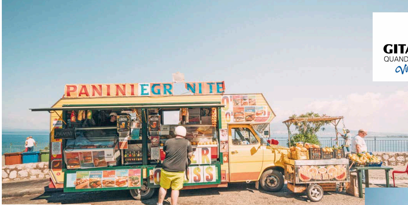
In alto: banco di granite e frutta fresca lungo la Costiera Amalfitana. In basso, da sinistra: Villa Rufolo a Ravello; Positano.

Tour in aereo: salutiamo l'accompagnatore e il resto del gruppo. In base all'orario di partenza del volo, possiamo avere del tempo a disposizione prima di venire accompagnati in aeroporto per il rientro. L'assistente è disponibile per organizzare il trasferimento all'aeroporto di Napoli.