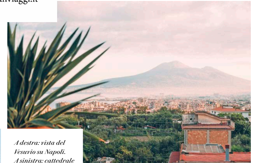
A destra: vista del Vesuvio su Napoli. A sinistra: cattedrale di Santa Maria Assunta a Napoli.