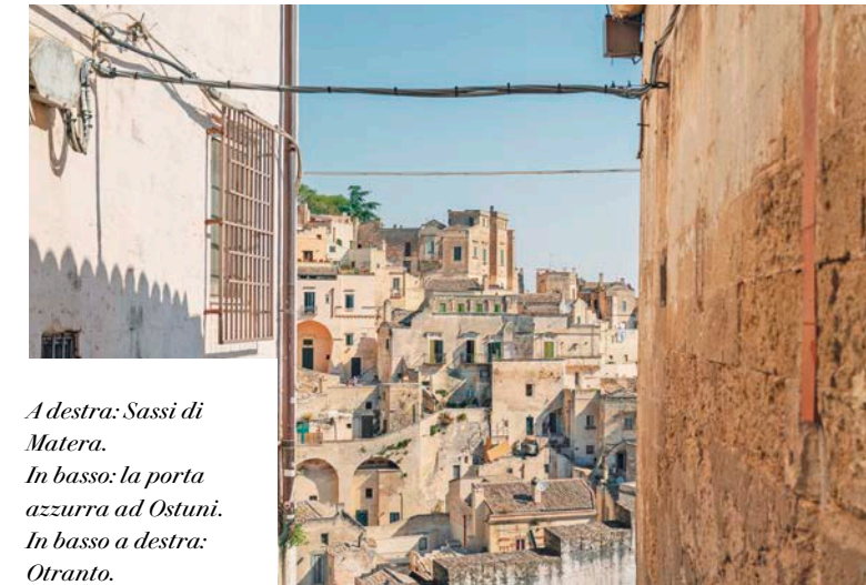
A destra: Sassi di Matera. In basso: la porta azzurra ad Ostuni. In basso a destra: Otranto.