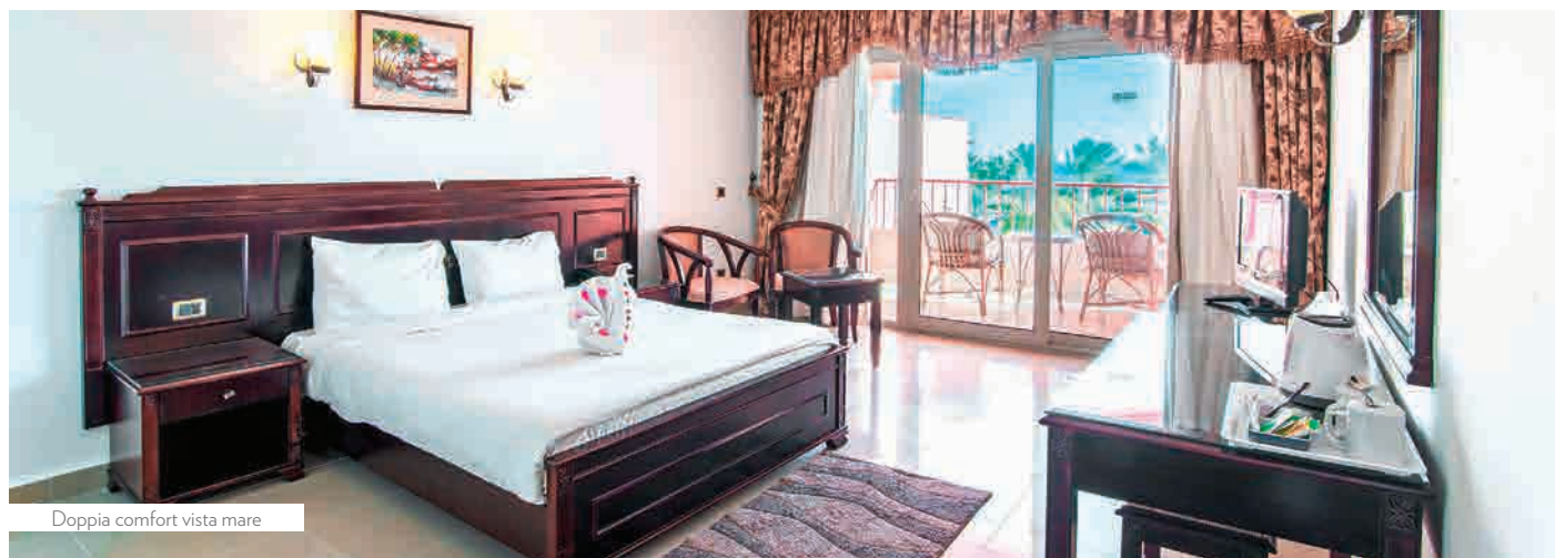
Doppia comfort vista mare