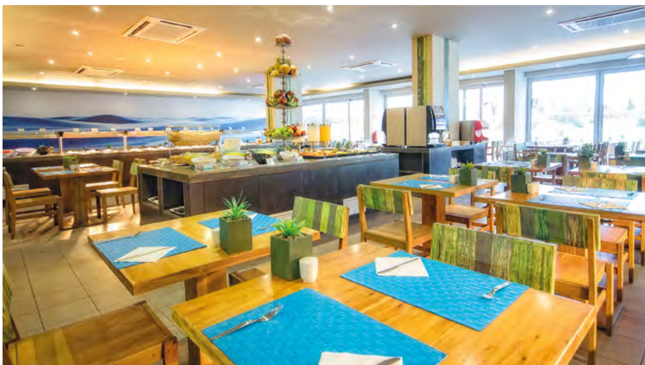
RISTORANTE PRINCIPALE "TABANKA"