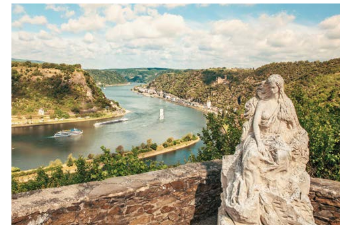
A destra: vista panoramica della Valle del Reno. Sotto: edificio dell'Autorità portuale dell'architetto Zaha Hadid ad Anversa