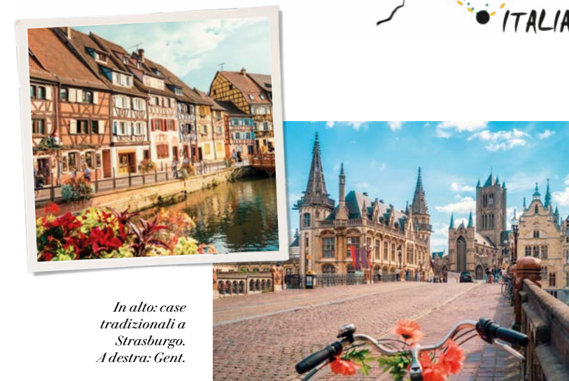
In alto: case tradizionali a Strasburgo. A destra: Gent.

nel pomeriggio è possibile partecipare a un'escursione opzionale al villaggio di Zaanse Schans . Nel periodo dal 23 marzo al 14 maggio l'escursione sarà sostituita dalla visita al parco Keukenhof . Ceniamo in serata.