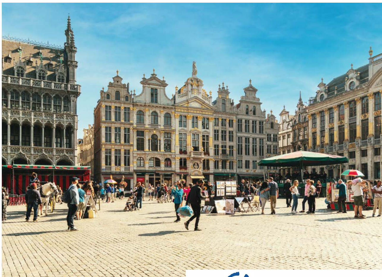
In questa pagina, dall'alto: veduta aerea della piazza Grote Markt a Bruges; Grand Place a Bruxelles.