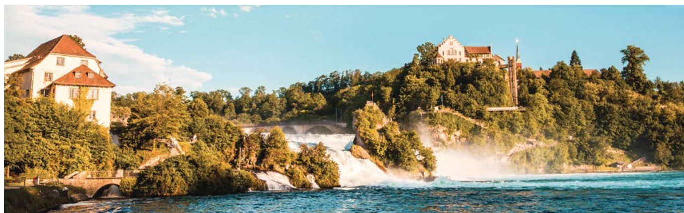
In questa pagina: cascate di Sciaffusa.