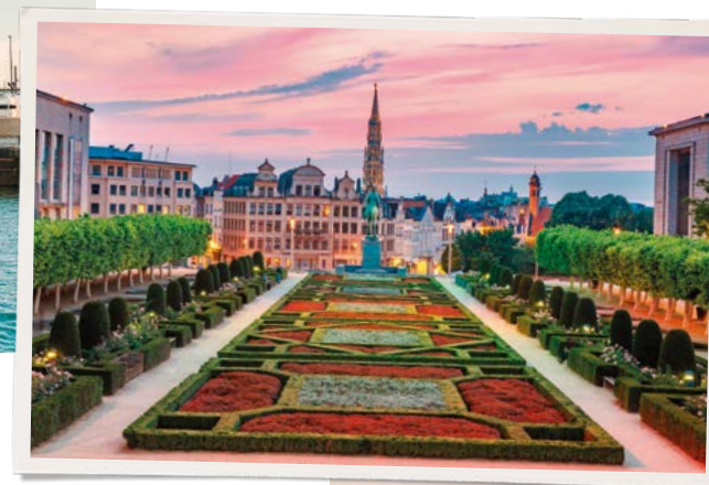
A sinistra: Bruxelles. Sotto: Delft.

Amsterdam: parco Keukenhof (solo per i tour che soggiornano ad Amsterdam dal 23 marzo al 14 maggio); tour serale lungo i canali; villaggio di Zaanse Schans.