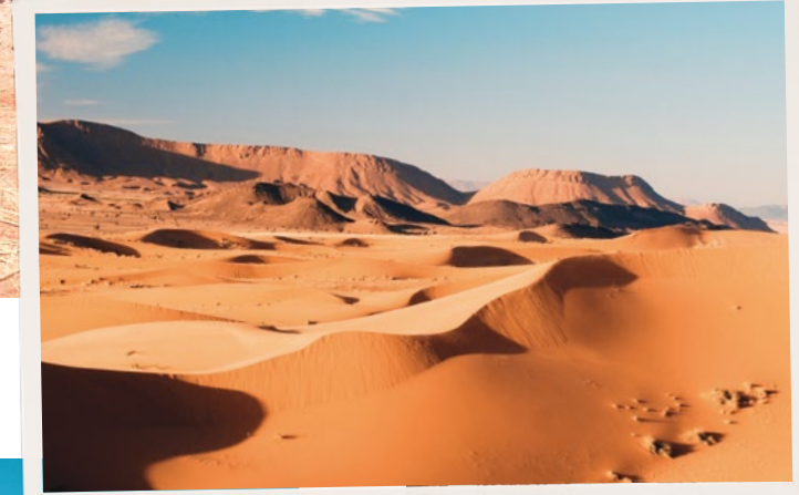
A sinistra: deserto di Merzouga. Sotto: souk a Fès.