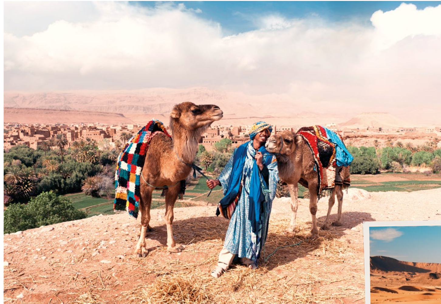
In alto: beduino a Tinghir. Nella pagina a fianco: Jardin Majorelle a Marrakech. Sotto: Essaouira.

In base all'orario del volo abbiamo del tempo libero a disposizione prima del rientro in Italia.