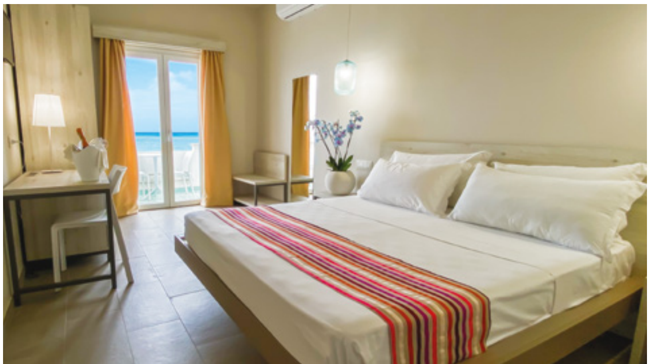
CAMERA STANDARD VISTA MARE