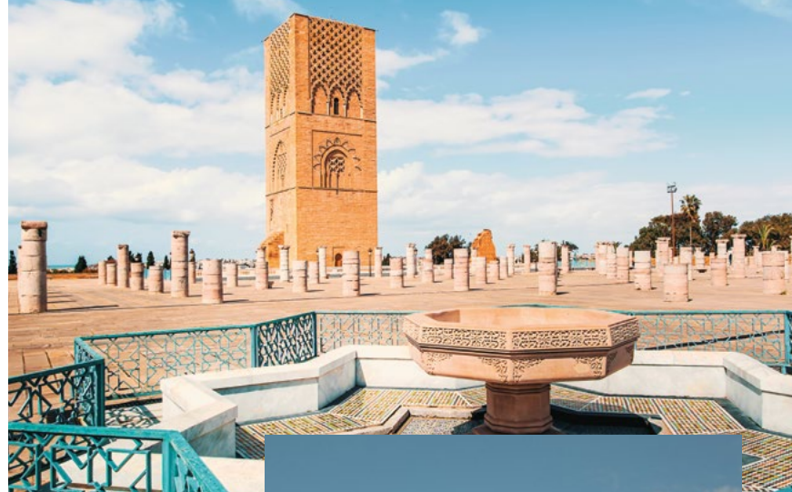
In questa pagina, dall'alto: minareto a Rabat; torre della Koutoubia a Marrakech; moschea di Hassan II a Casablanca; tè marocchino.

In base all'orario del volo abbiamo del tempo libero a disposizione prima del rientro in Italia.