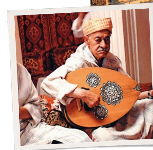
Nella pagina a fianco, dall'alto: Palazzo Bahia a Marrakech; Chefchaouen. In questa pagina, in alto: rovine del sito archeologico di Volubilis. A sinistra: suonatore di mandolino.